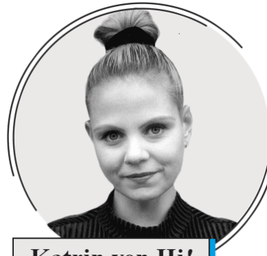
Katrin von Hi!

Wusstest du, dass du sogar wissenschaftlich belegen kannst, dass Kollege X aus deiner Sicht ein Arschloch ist? Dieser Beitrag von ARTE bringt erhellende Erkenntnisse!